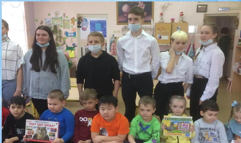
акция «Добрые дела»