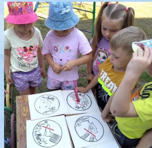
Правила поведения в лесу