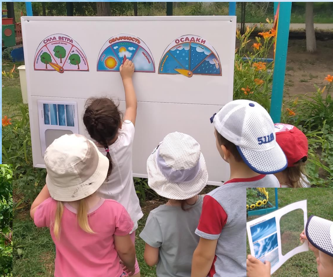
Работа на метеостанции