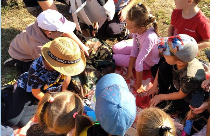
акция «Добрые дела»