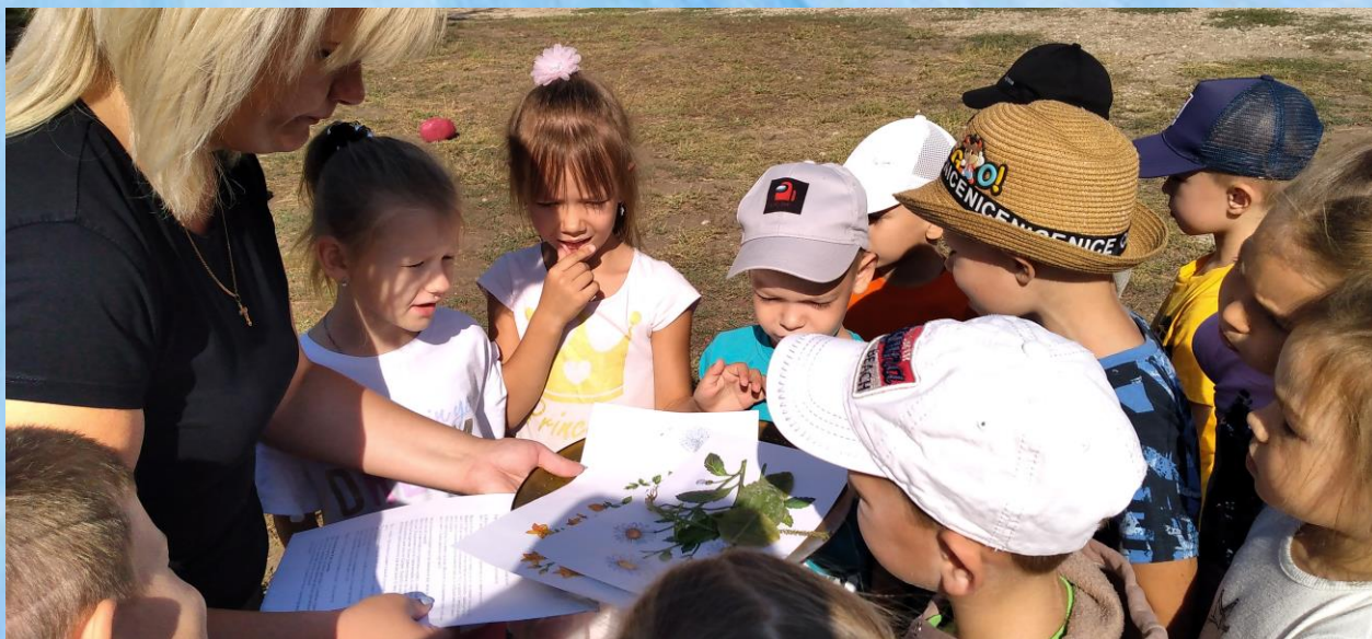
Беседы о ЗОЖ