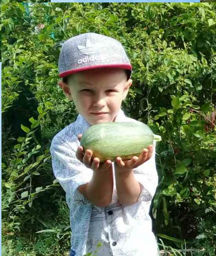
Труд на огороде