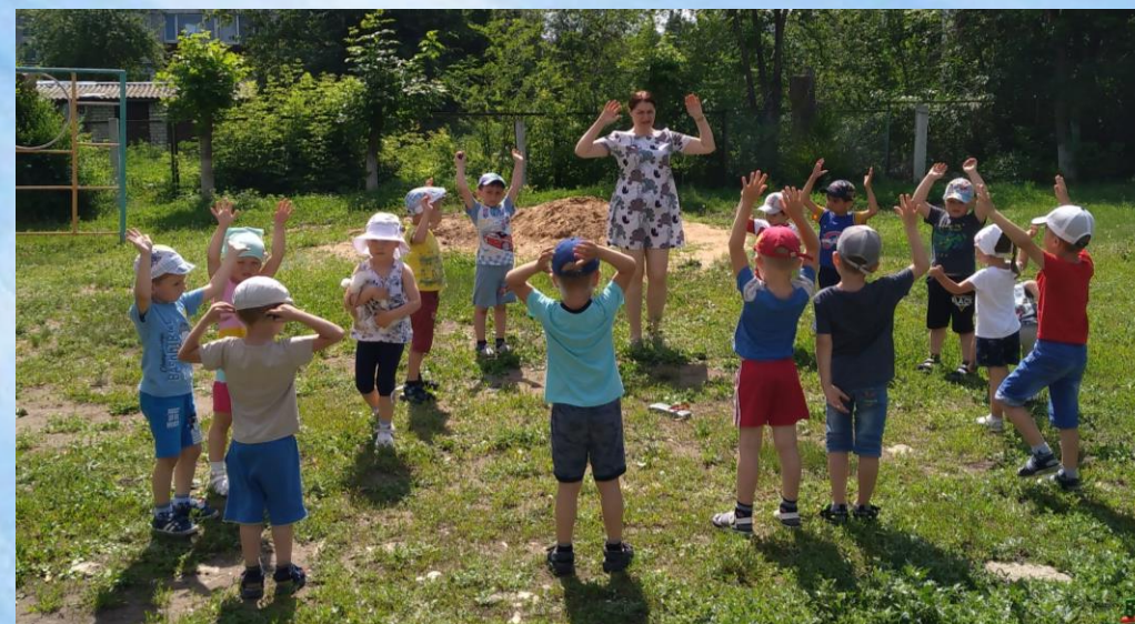
Гимнастика после сна