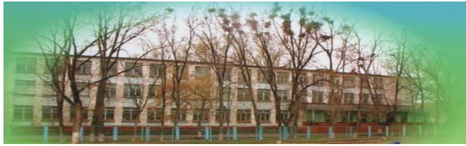
Ежемесячная школьная газета ГБОУ СОШ №1 с.Приволжье муниципального района Приволжский Самарской области Выпускается с 1 сентября 2008 года

День дурака пока не признан официальным праздником, но это не мешает гражданам различных стран веселиться в этот день и разыгрывать друг друга. Где именно появилась традиция подшучивать в первый апрельский день, точно не установлено. По одним источникам День смеха зародился во Франции после перехода на Григорианский календарь и переноса даты встречи Нового года с 1 апреля на 1 января. Люди, наряжавшиеся в апреле в новогодние костюмы, выглядели нелепо. Над ними все подшучивали и называли дураками.