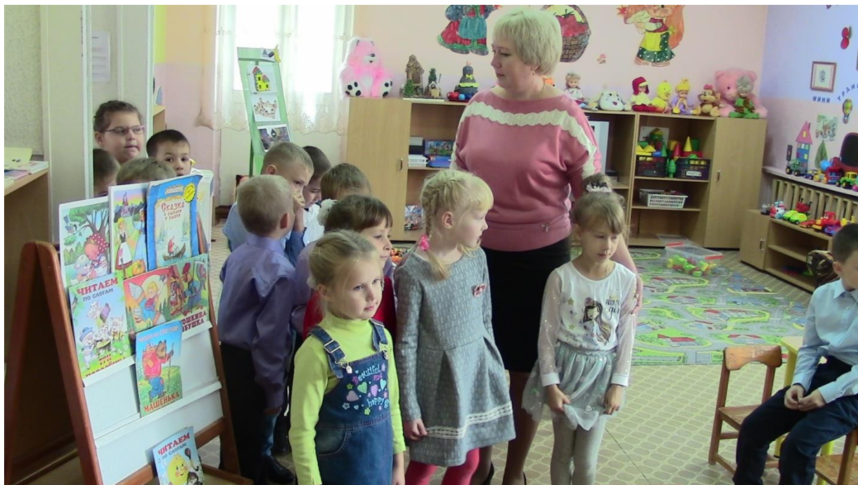
Самостоятельная игровая деятельность «Играем? Конечно!» в подготовительной к школе группе