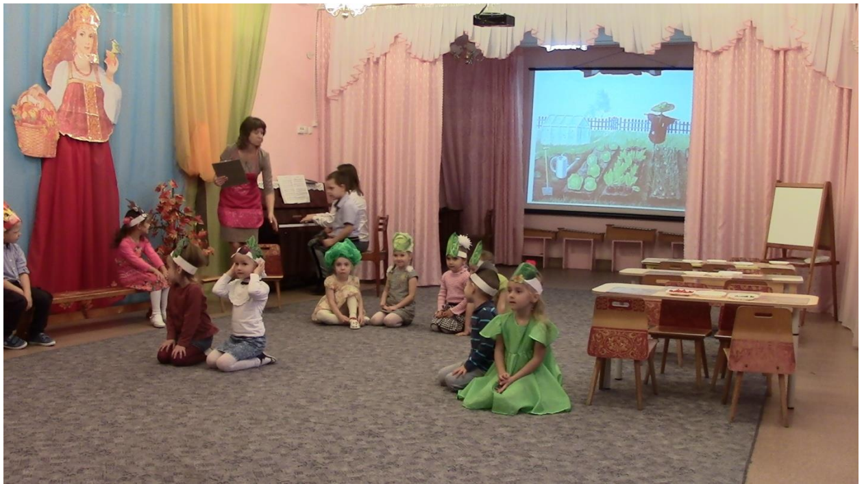
НОД «На огороде» по изобразительной деятельности с элементами театрализованной игры в средней группе