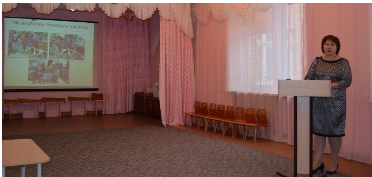
Выступление с презентацией «Использование конструктора Лего в театрализованной деятельности в детском саду»