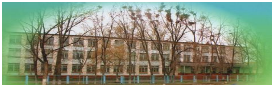
Ежемесячная школьная газета ГБОУ СОШ №1 с.Приволжье муниципального района Приволжский Самарской области Выпускается с 1 сентября 2008 года